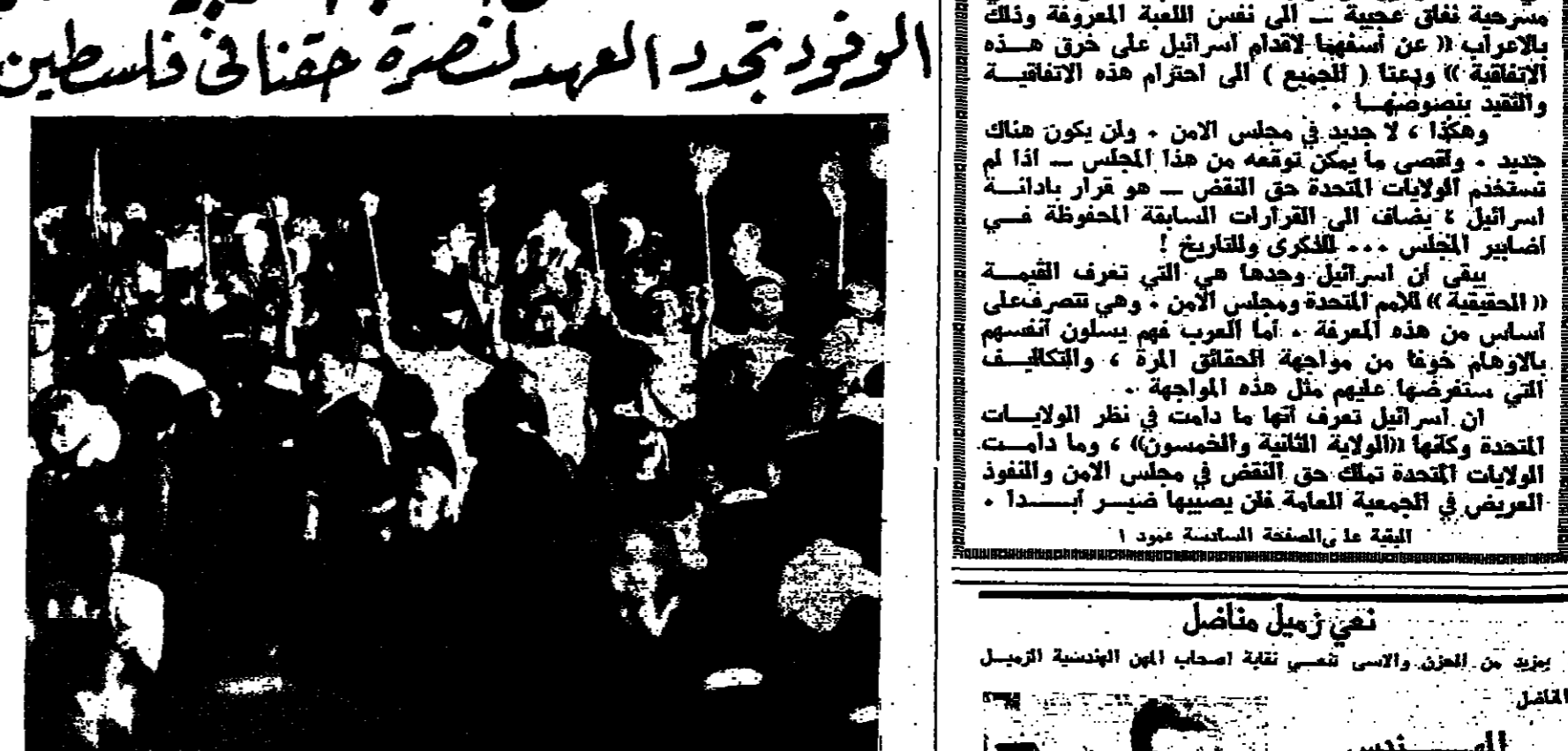
شباب صوفيا يستقبلون المسيرة العربية بالشامل ( الصورة اخرى من صوفيا ص ٦ )

صوفيا - من فوز الحرس التسويحي كان يوم الازياء الحادي والثلاثون من شهر تموز الماضي يوم القتل للامم مع الشعوب العربية في مهرجان التسوية العالية الذي يقام هنا في عاصمة بلغاريا . وقد تلت الوفود العربية التي اجتاز تهدي لتسقي التعاون بينها